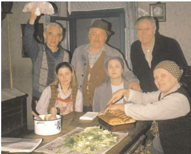
Fotografija sa snimanja Dirigenta i mužiakaša