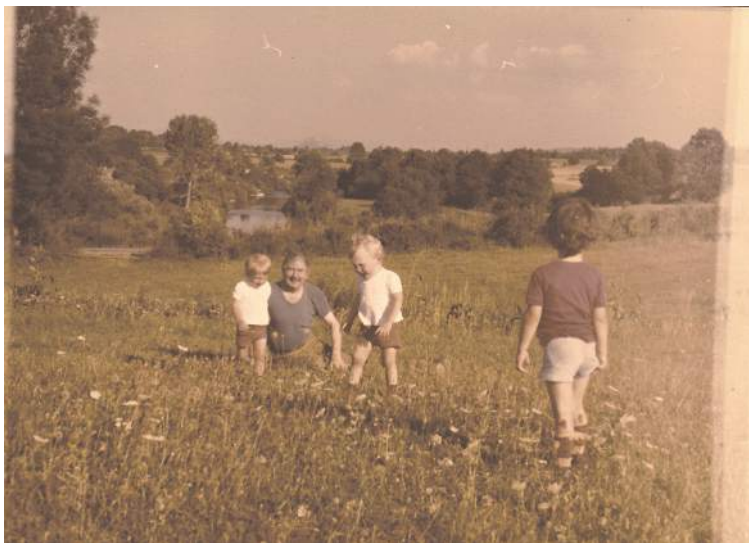
Tata i mi