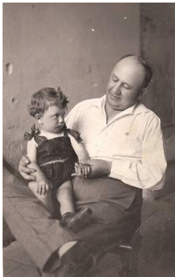
Fotografije iz najranijeg djetinjstva