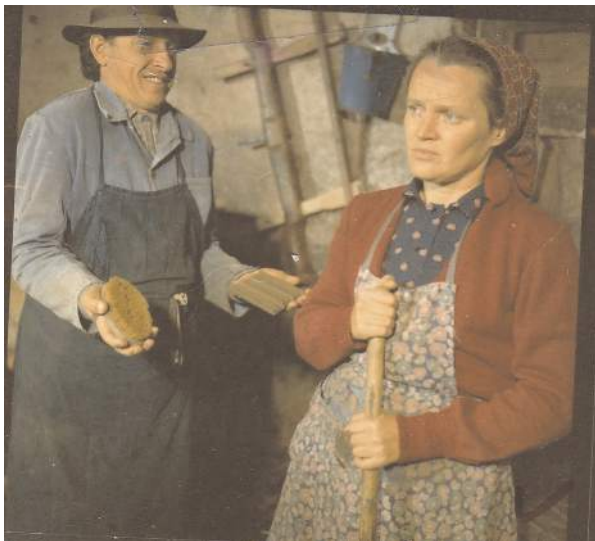
Fotografije sa snimanja Gruntovčana

zaslužni svi spomenuti koji su neposredno sudjelovali u njenom stvaranju, ali i oni koji su na posredan način kroz godine davali podršku tati da seriju u miru promisli i zgotovi.