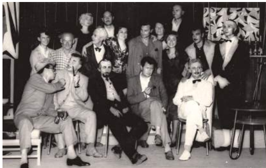
Fotografije iz kazališnog amaterskog života